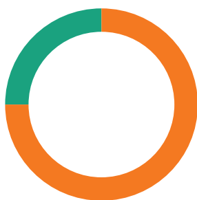
FÖRDELNING AV SBAB:S TOTALA UTLÅNING

— Privatpersoner, 250,1 mdkr (75 %) — Företag, 85,0 mdkr (25 %)